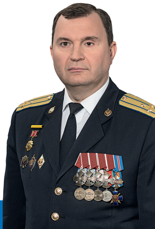
С.В. МИЛИЦКИЙ, Заместитель председателя Федерального политического комитета

потоком социальных обещаний. При этом реальные решения принимаются в интересах финансовых воротил. Отменяются льготы для социально незащищенных граждан, заморажива-